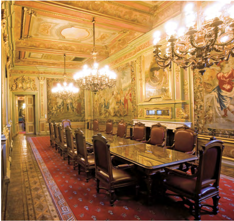
The Maximilian room of the City Hall La salle Maximilienne de l'Hôtel de Ville De Maximiliaanzaal in het stadhuis Der Maximiliansaal des Rathauses