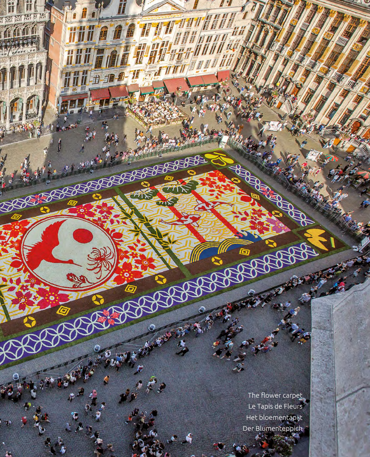
The flower carpet Le Tapis de Fleurs Het bloementapijt Der Blumentepich