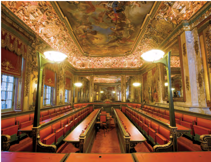
The Council Chamber La salle du conseil communal De gemeenteraadszaal Der Saal des Gemeinderates