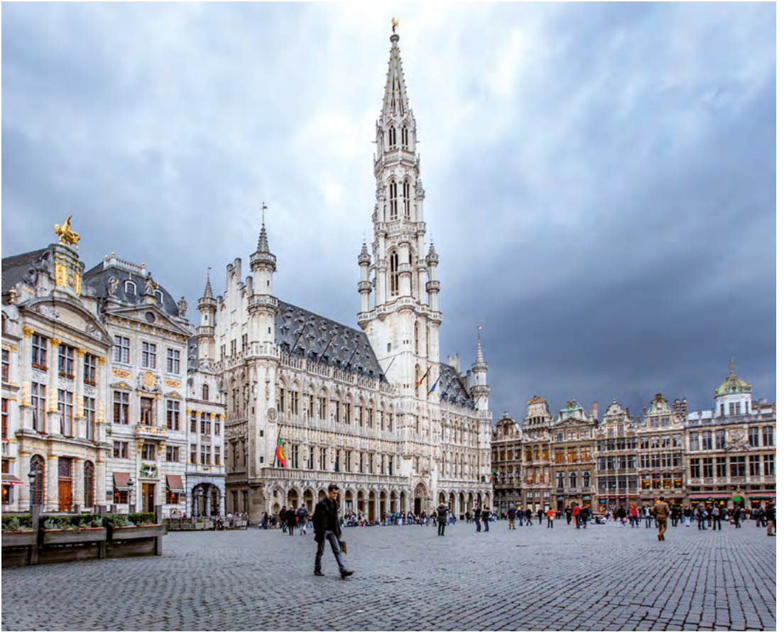
The Grand Place – City Hall La Grand-Place – Hôtel de Ville De Grote Markt – Het Stadhuis Der Grand' Place – Rathaus